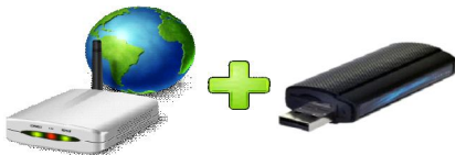
Connessione a internet principale più eventuale connessione di riserva