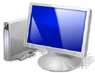
Personal Computer o Notebook